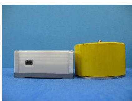
センサ部 (新旧比較-2)