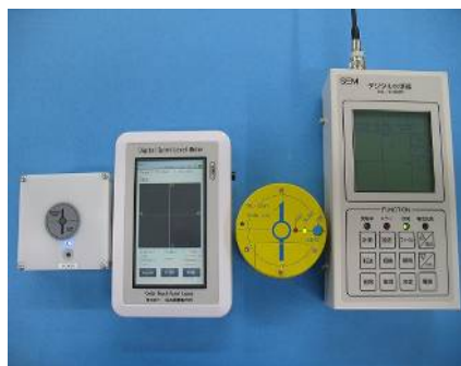
無線式水準器 (新旧比較)